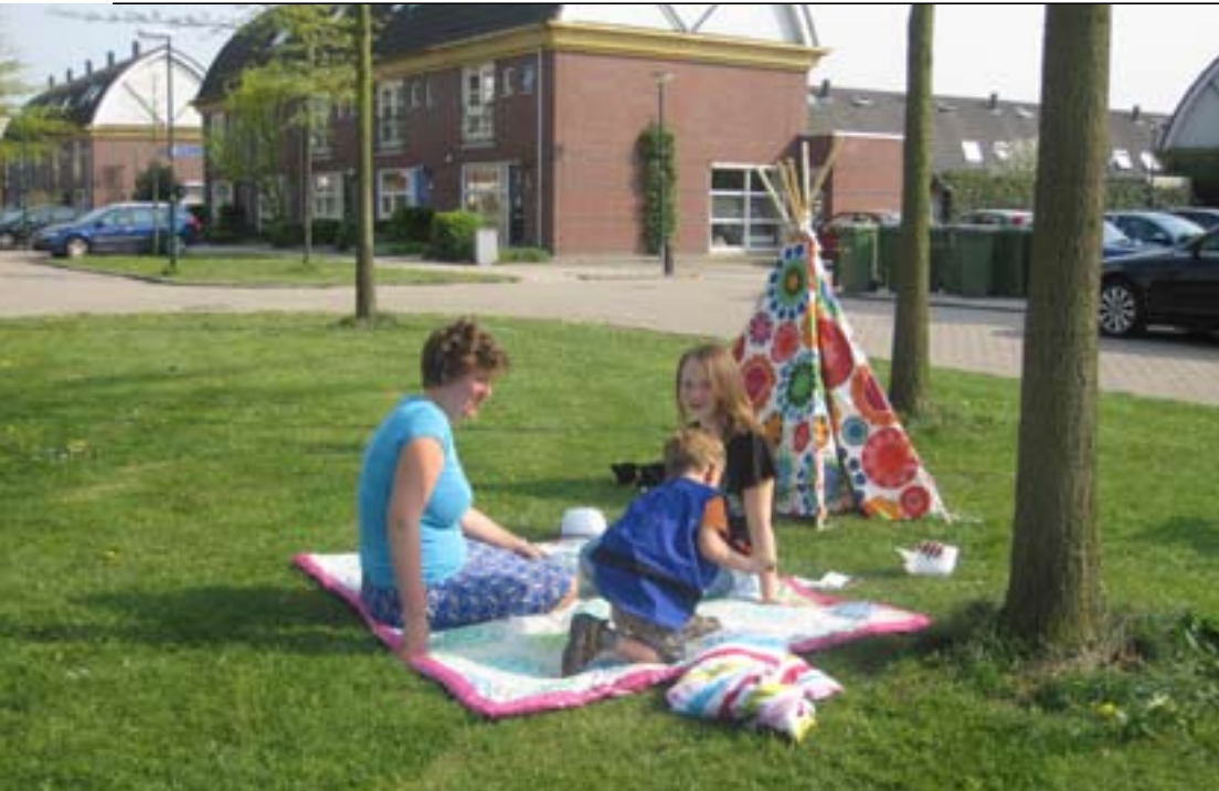
Openbare ruimte wordt weer gezamenlijke ruimte (Houten Zuid).

bedenken welke projecten een bijdrage zouden kunnen leveren aan het beheer van de openbare ruimte. Daarnaast is het van cruciaal belang dat Welzijn juist de buitenstaanders, die in het beheer een belangrijke rol kunnen spelen, op de juiste wijze informeert over het feit dat zij blijvend hun directe omgeving kunnen vormen. Voor het succes van het plan en voor de sociale cohesie in een buurt is het belangrijk dat het begonnen werk wordt verder gebracht. Wanneer gebruikers eenmaal over de drempel zijn en hebben meegewerkt aan een herinrichting van hun directe omgeving, is het zaak om hun inzet en inbreng vast te houden. Er gaat anders een kapitaal aan menskracht verloren, zeker als je bedenkt dat de groep buitenstaanders nu al 32 procent van de samenleving vormt en deze naar verwachting nog zal groeien.