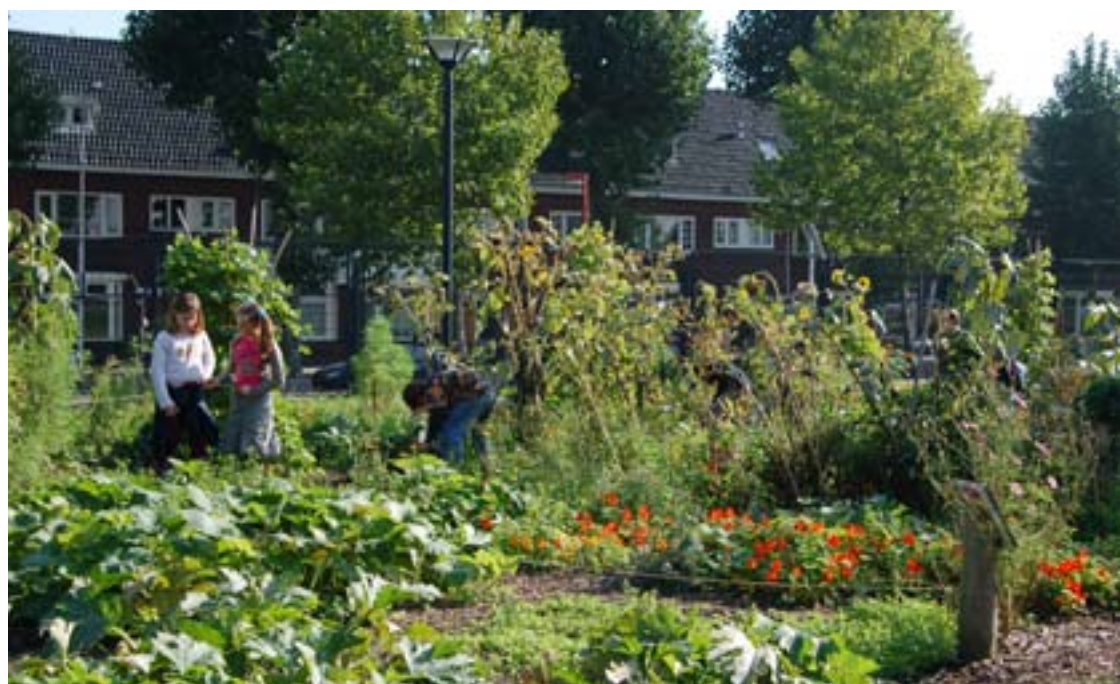
Schoolkinderen werken mee in de moestuin.

Doordat de moestuinen in verbinding worden gebracht met het Brede Schoolplein, is er automatisch een deel van het beheer van de omgeving (dat anders openbaar groen zou zijn) geregeld in eigenbeheer. Door het schoolplein open te stellen en plein en omgeving multifunctioneel in te richten ontstaat de kans om steeds meer beheer uit handen te geven. Ook nu is de aanwezigheid van Welzijn erg belangrijk, omdat zij weten of kunnen